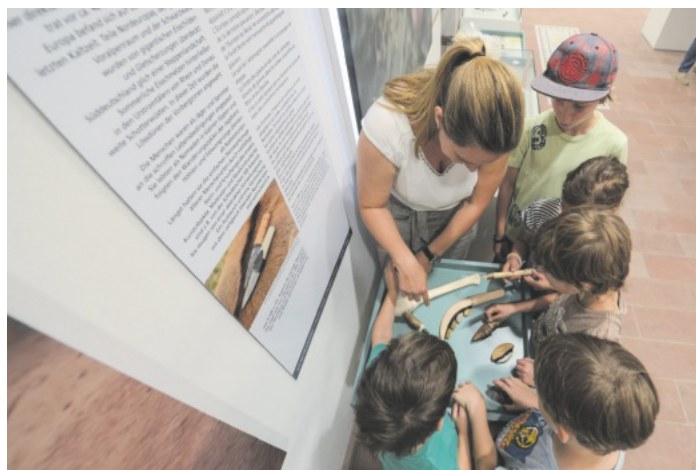
Auf Tour im Museum

Anmeldung bis Vortag 14 Uhr an museum@offenburg.de oder Tel. 0781 82 2577.