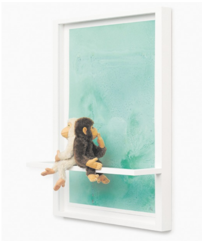
Kuscheltiere als Teil eines Kunstwerks, zu sehen in der aktuellen Ausstellung.

Am Donnerstag, den 04.06.2026 um 19.00 Uhr , lädt das Museum im Ritterhaus am Langen Donnerstag zu einer Führung zur Kulturgeschichte des Essens und Trinkens in der rö-