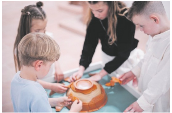
Das Museum im Ritterhaus entdecken! Das geht am Internationalen Museumstag!

Deutschlandweit laden Museen am Sonntag, 17. Mai 2026 unter der Leitlinie "Museen entdecken" zum Internationalen Museumstag in ihre Häuser ein. Die Museen präsentieren sich als Orte des gesellschaftlichen und kulturellen Austauschs und ermöglichen besondere Einblicke in eine vielfältige Museumslandschaft. Das Motto des diesjährigen Museumstages in Baden-Württemberg lautet dabei „Baden-Württemberg erzählt.“ Das Museum im Ritterhaus, die Mikwe, der Salmen und die Städtische Galerie sind ebenfalls dabei und bieten den Besuchenden an diesem Tag bei freiem Eintritt ein abwechslungsreiches Sonderprogramm.